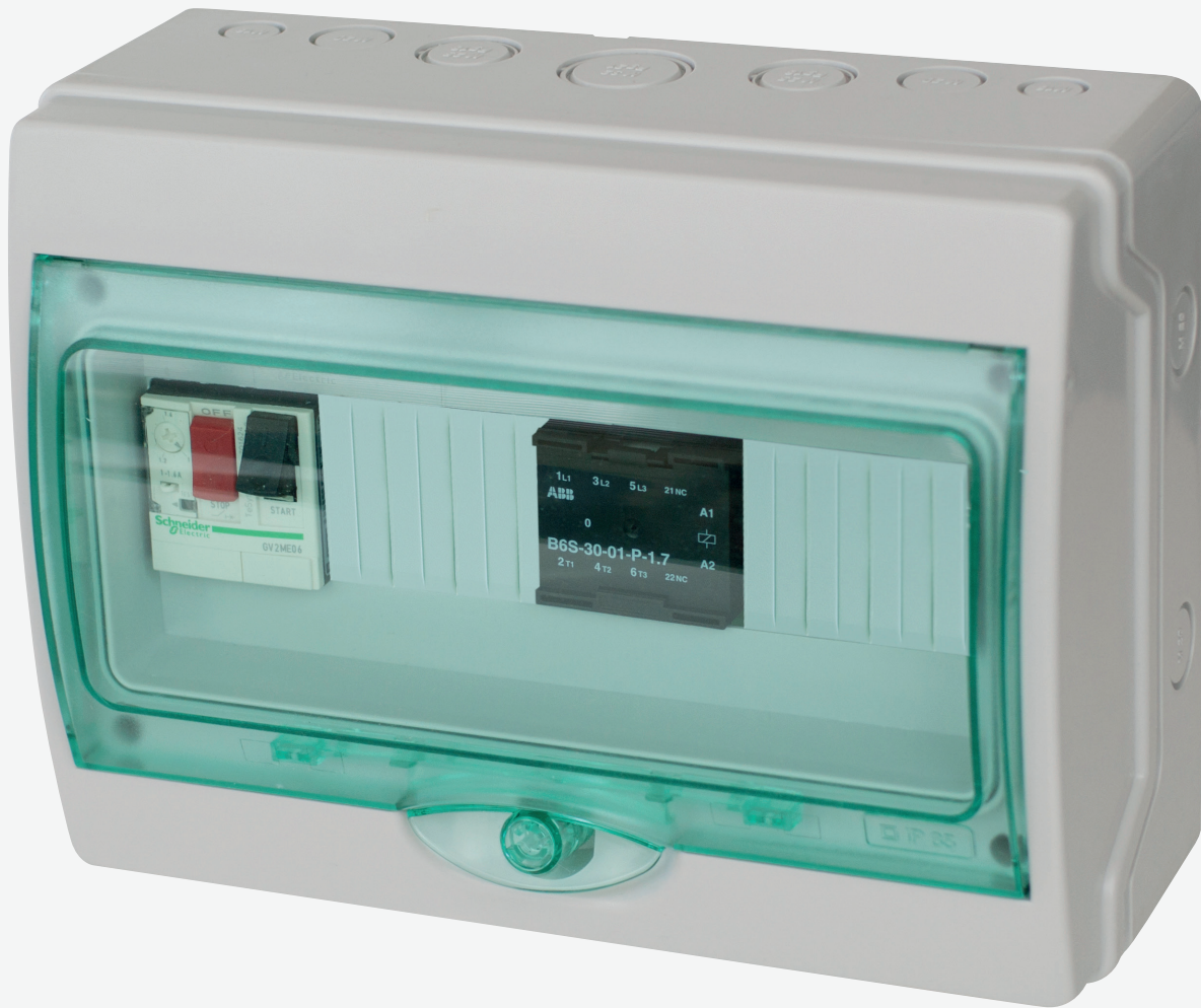
C1MG 0.4/0.6A: PUI0002 C1MG 0.25/0.4A: PUI3031